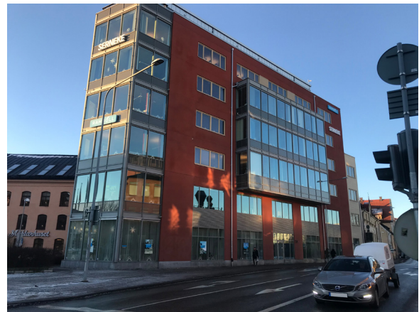
Gebäude in Uppsala, Schweden

Bildquelle in Druckqualität: www.fep.fraunhofer.de/presse