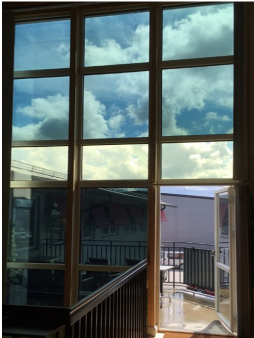
Wirkung von elektrochromen Fenstern